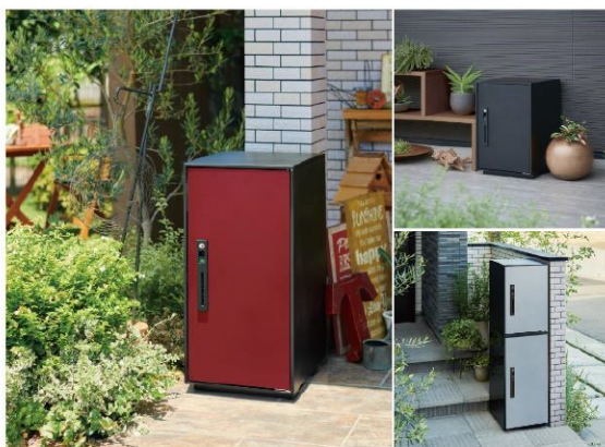
後付け用宅配ボックス コンボ-ライト

荷物の配達・受け入れがカンタン! 床面に本体をしっかり 固定するので、防犯面も安心です。(電気も不要です)